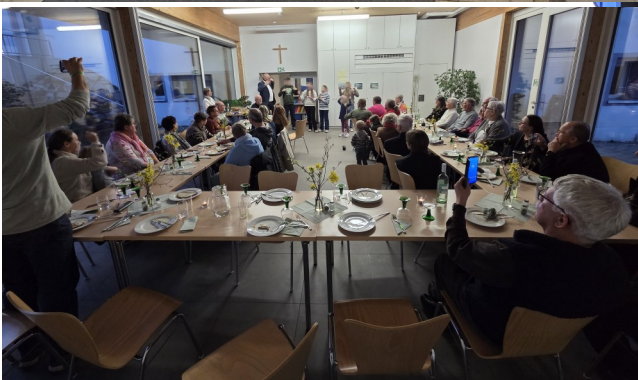
„Abendmahl“ am Gründonnerstag