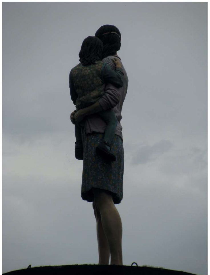
Christoph Pöggeler, Fremde , Düsseldorf 2006

Grenzen überwinden – auch das ein Thema dieses Monats. Gott überschreitet eine Grenze und wurde Mensch, damit alle Menschen hoffnungsfroher in die Zukunft schauen können.